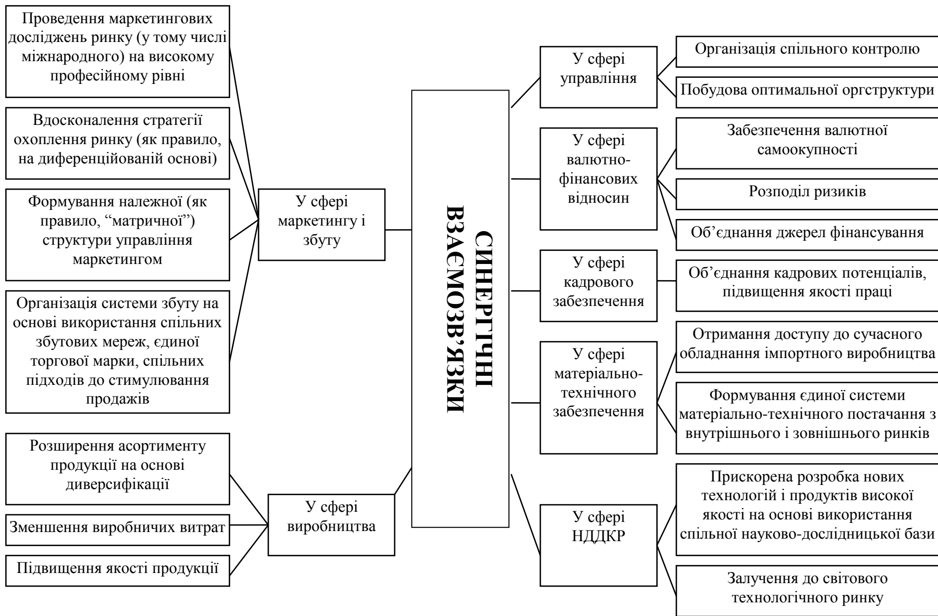
Рис. 2. Структура синергічних взаємозв'язків партнерів у межах спільного підприємства