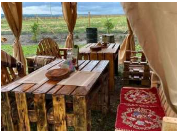
Рисунок 2.3 – Облаштування зони відпочинку та дегустації на фермі «Епіравлик»

Попри початок повномасштабного вторгнення в лютому 2022 року та введення воєнного стану, туристичний сезон розпочався в червні, і власникам вдалося повністю окупили витрати на запуск бізнесу та отримати прибуток у розмірі 10% від вкладених коштів, що склало 50 000 грн. Усі отримані кошти були спрямовані на подальший розвиток ферми та облаштування зон відпочинку (рисунок 2.3).