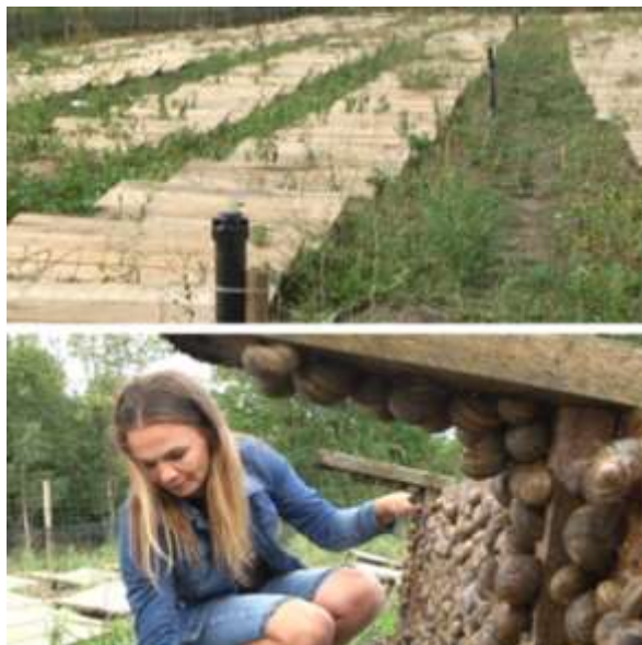
Рисунок 2.2 – Особливості вирощування равликів на ферми «Еріравлик»

Попри початок повномасштабного вторгнення в лютому 2022 року та введення воєнного стану, туристичний сезон розпочався в червні, і власникам вдалося повністю окупили витрати на запуск бізнесу та отримати прибуток у розмірі 10% від вкладених коштів, що склало 50 000 грн. Усі отримані кошти були спрямовані на подальший розвиток ферми та облаштування зон відпочинку (рисунок 2.3).