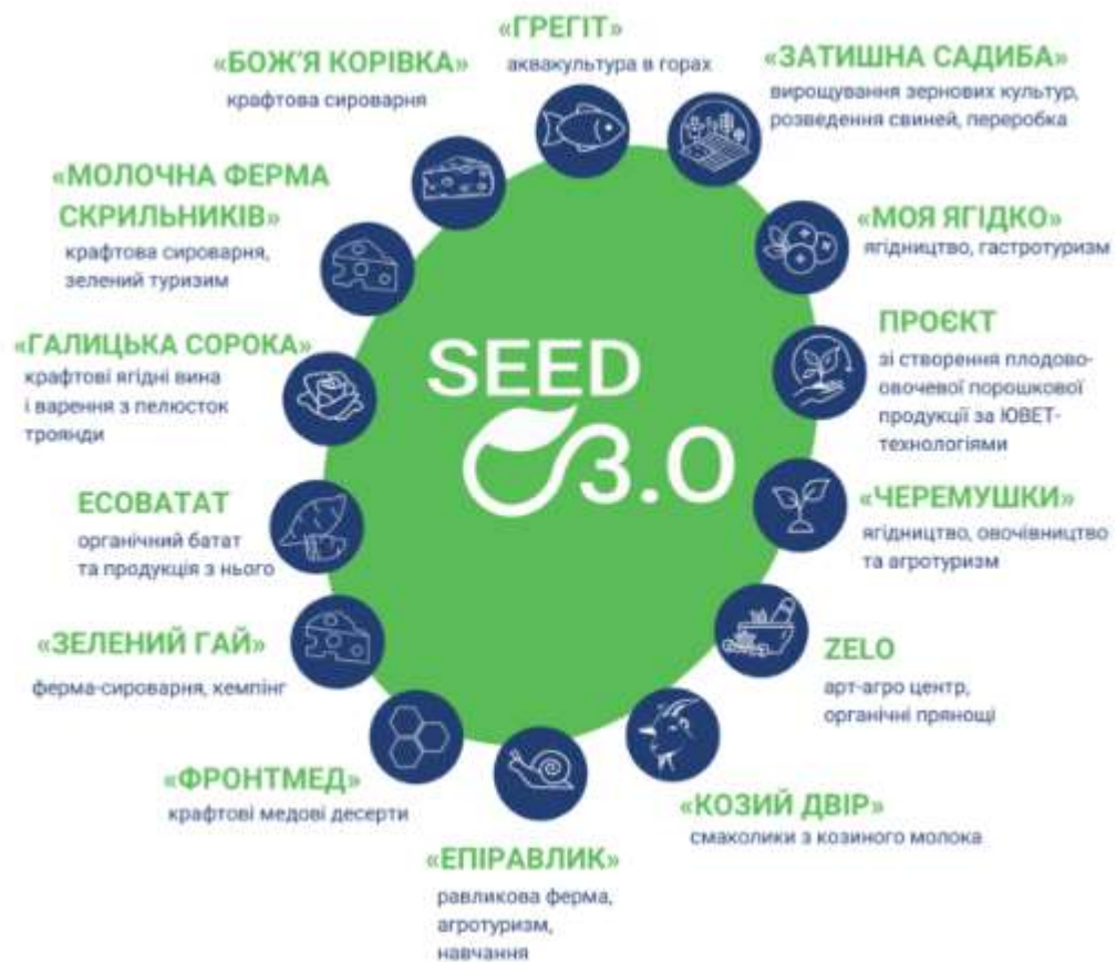
Рисунок 2.4 – Переможці третьої хвилі проекту SEED

Проект сприяє досягненню прогресу в реалізації Цілей сталого розвитку (ЦСР) та розвитку громад.