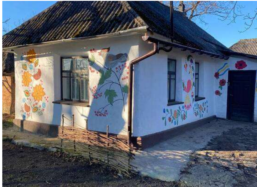
Рисунок 2.1 – Облаштування равликової ферми

Ферма «ЕпіРавлик» відкрилася для відвідувачів у червні 2021 року, що ознаменувало початок її першого туристичного сезону. На території ферми знаходиться відреставрована столітня українська хата, яка слугує місцем для відпочинку та є чудовою локацією для фотосесій. Крім цього, облаштовано кілька унікальних фотозон, які також користуються великою популярністю серед гостей (рисунок 2.1).