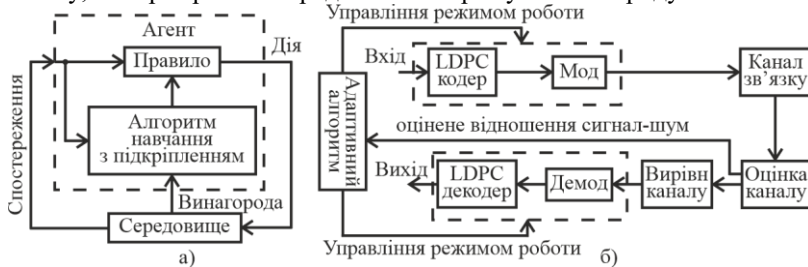
Рис. 1. а – Схема взаємодії агента RL з середовищем; б – схема системи зв'язку, що використовує навчання з підкріпленням (RL)

Сучасні бездротові системи зв'язку працюють в умовах завмирань, завад, швидких змін стану каналу та зростаючих вимог до швидкості передавання і якості обслуговування. Використання адаптивної модуляції і кодування дає змогу динамічно змінювати вид модуляції та кодову швидкість відповідно до поточного стану каналу, забезпечуючи компроміс між спектральною ефективністю, часткою помилкових блоків і затримкою. Reinforcement Learning (рис. 1) здійснюється через багаторазову взаємодію із середовищем і є інтелектуальною надбудовою для вибору режиму передавання. Замість жорсткої таблиці порогів для певного відношення сигнал/шум присутній агент, який після кожного фрейму або інтервалу передавання спостерігає стан каналу, вибирає режим передавання і отримує "винагороду".