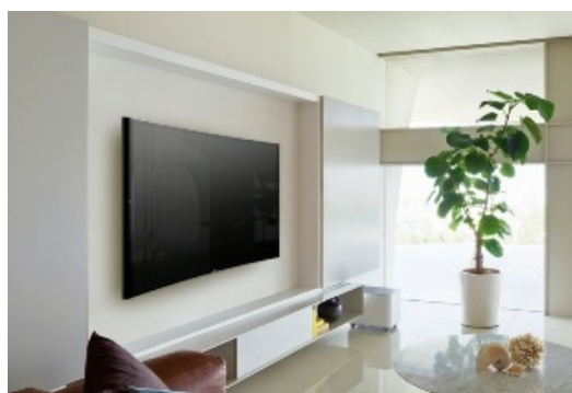
Рис. 2. Настільна і настінна конструкції телевізорів

Призначення об'єктів дизайну не вичерпується їх прикладними характеристиками: наприклад, картини та скульптури не виконують в інтер'єрі жодної функції, але надають життєвому простору особливої енергії. Нова концепція гармонійного мінімалізму змінює уявлення про пристрої, наділяючи їх характеристиками предметів мистецтва. Телевізор перетворюється з об'єкта, що порушує загальний дизайн, на важливий елемент інтер'єру навіть у вимкненому стані. Наприклад елегантну підставку телевізора BRAVIA® утворюють металеві бруси простої геометричної форми, що лише в кількох точках спираються на поверхню. Унікальне поєднання прихованої напруги й рівноваги в цьому дизайні нагадує вишуканий витвір мистецтва. Підставка у вигляді перевернутої літери V – надійна опора для телевізора, на яку можна встановити аудіопанель. До того ж її ретельно продуманий дизайн доповнить будь-який інтер'єр.