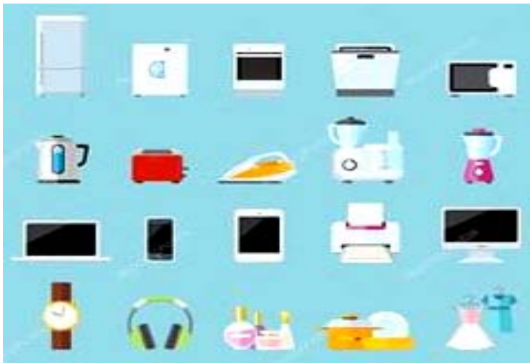
Рис. 1. Зразки сучасної електропобутової техніки

Дизайн сучасної електропобутової техніки ставить перед собою задачі, пов'язані не тільки з вирішенням проблем матеріального оснащення побуту, але і доволі конкретні задачі, направлені на активізацію пасивного споживання. Дизайн допомагає людині відчути насиченість власного існування різноманіттям можливостей сучасної електропобутової техніки.