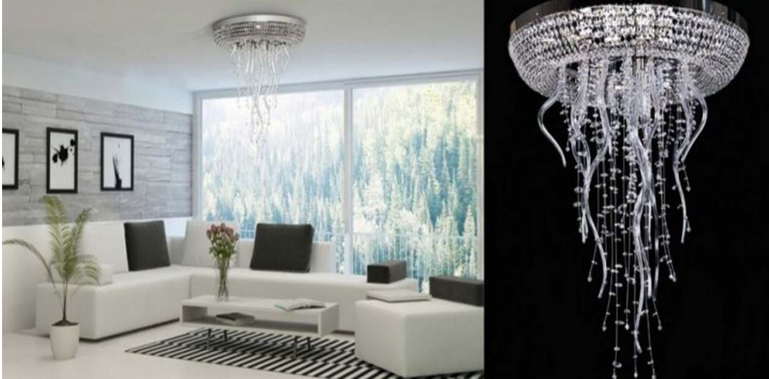
Рис. 4. Варіант вибору люстри у відповідності до інтер'єру

до призначення того чи іншого приміщення. Дизайн освітлення кімнат є важливим етапом в плануванні інтер'єру. У кухні, наприклад, нас в першу чергу цікавить функціональний аспект освітлення “робочого місця”. Точно так само нам не байдужий і ступінь освітленості письмового столу в кабінеті. У спальні або вітальні на перший план виступають питання естетики і створення сприятливої для відпочинку емоційної атмосфери. Взагалі, в дизайні освітлення, при всій його раціональності, утримується якийсь елемент магії. Світло – настільки сильний і пластичний “матеріал”, що з його допомогою можна “виліпити” будь-який образ предмета. Стосовно до інтер'єру, роль світла зростає надзвичайно. Проектування дизайну освітлення кімнат – це один з найважливіших моментів роботи дизайнера під час створення різних образів інтер'єру.