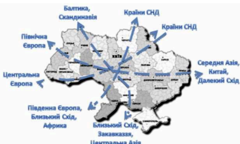
Рисунок 1.1 – Схема стратегічно важливих транспортних напрямків, що проходять територією України [27].

Україна традиційно відіграла важливу роль як транзитна держава на маршрутах постачання нафти та природного газу з Росії до країн Центральної та Південно-Східної Європи. Проте внаслідок повномасштабної війни, запроваджених санкцій і відмови більшості держав Східної Європи від російських енергоресурсів, значення України у цьому процесі наразі суттєво зменшилося.