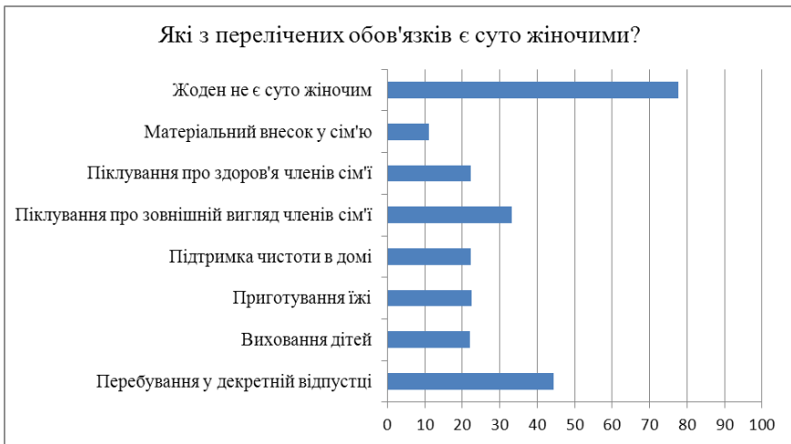
Рис. 3. Результати дослідження за розробленою анкетною

На рис. 3 наочно зображені у відсоткових коефіцієнтах тенденції виборів із варіантів відповідей на традиційне питання про жіночі якості.