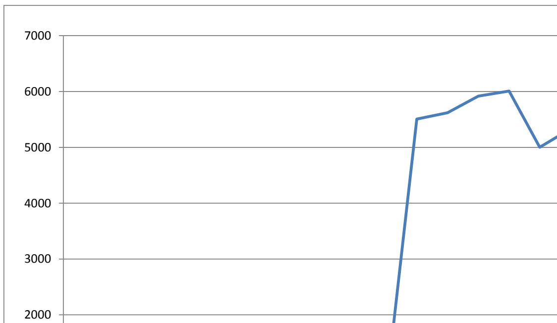
Рис. 1. Обсяги ПІІ з ФРН до України в період (млн дол. США)

Порівняння динаміки надходження ПІІ з ФРН із загальними обсягами надходження ПІІ в Україну наочно видно з графіків на рис. 1 і 2, що побудовані на основі даних таблиці 1.