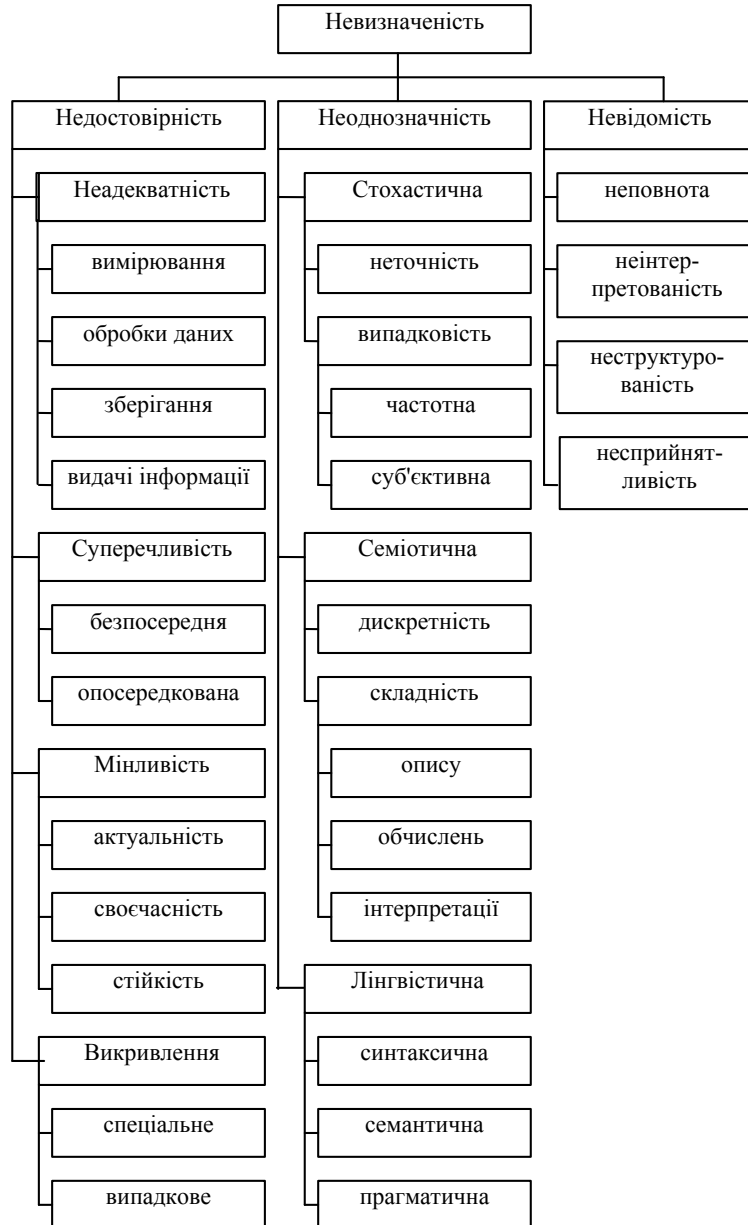
Рис. 1. Ієрархія видів невизначеності

довірчою імовірністю необхідної точності, тобто ймовірністю того, що відображувані інформацією значення параметра відрізняються від його істинного значення в межах необхідної точності. Основними причинами недостовірності інформації можуть бути: неадекватність (виникає внаслідок порушення процедур вимірювання, обробки, зберігання та видачі інформації); суперечливість (пов'язана з безпосередньою або опосередкованою невідповідністю між різними даними про об'єкт дослідження); мінливість (виникає, коли інформація не зберігає такі свої властивості як актуальність, своєчасність і стійкість); викривлення (пов'язане з діями суб'єкта управління (спеціальне або випадкове спотворення) при роботі з інформацією).