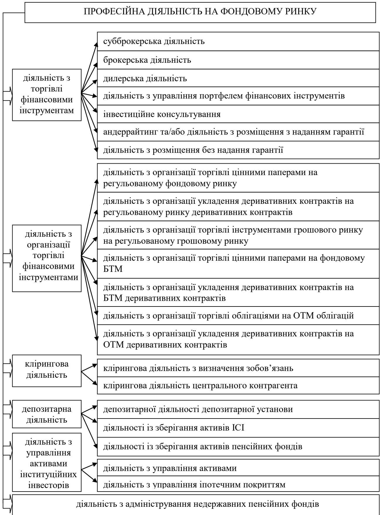
Рисунок 1.2 – Види та підвиди професійної діяльності на фондовому ринку