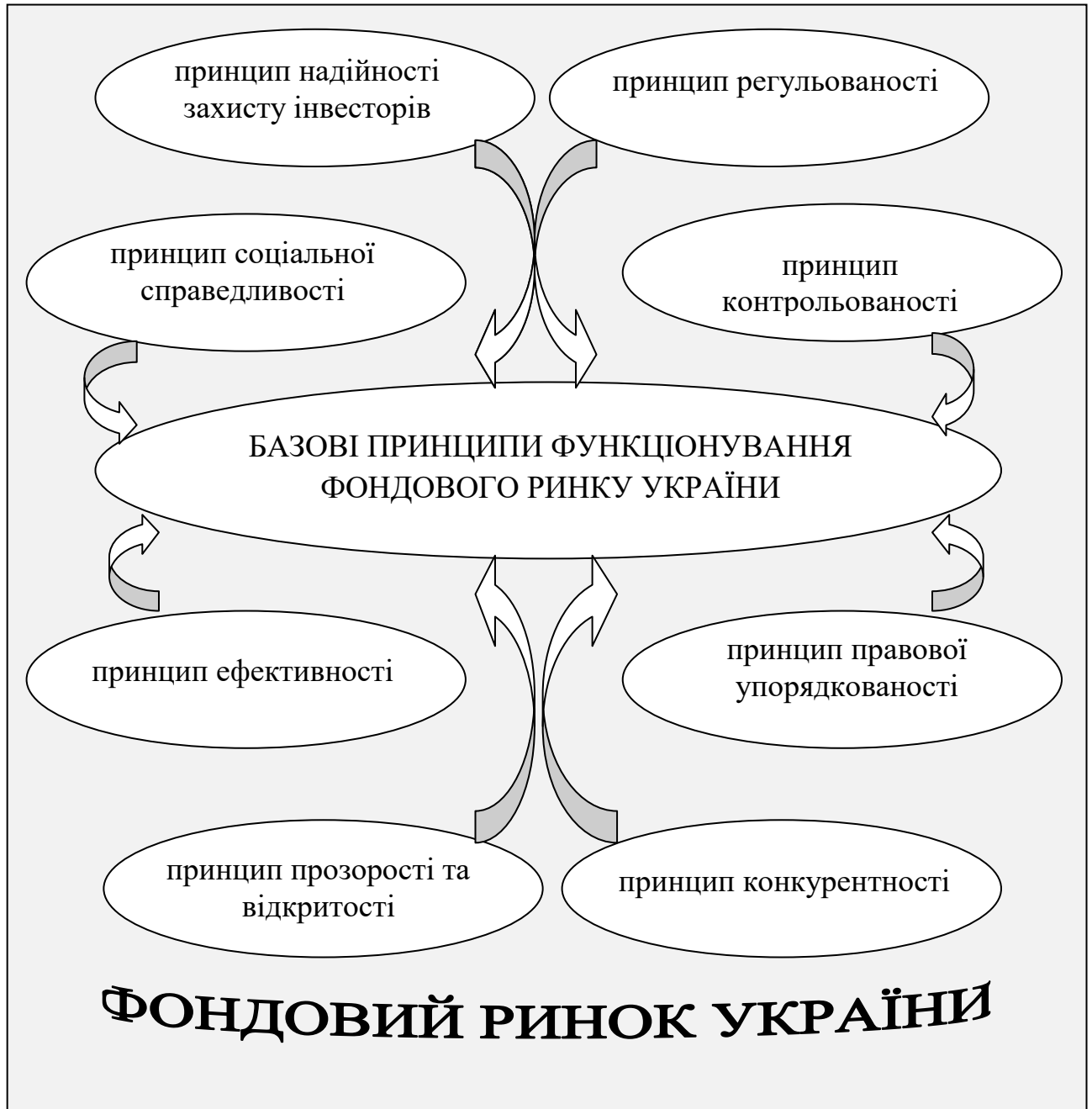
Рисунок 1.1 – Базові принципи функціонування фондового ринку України Складено за даними [34].

вільних фінансових ресурсів та встановлення немонопольних цін на послуги фінансових посередників за умов контролю за дотриманням правил добросовісної конкуренції учасниками фондового ринку" [34].