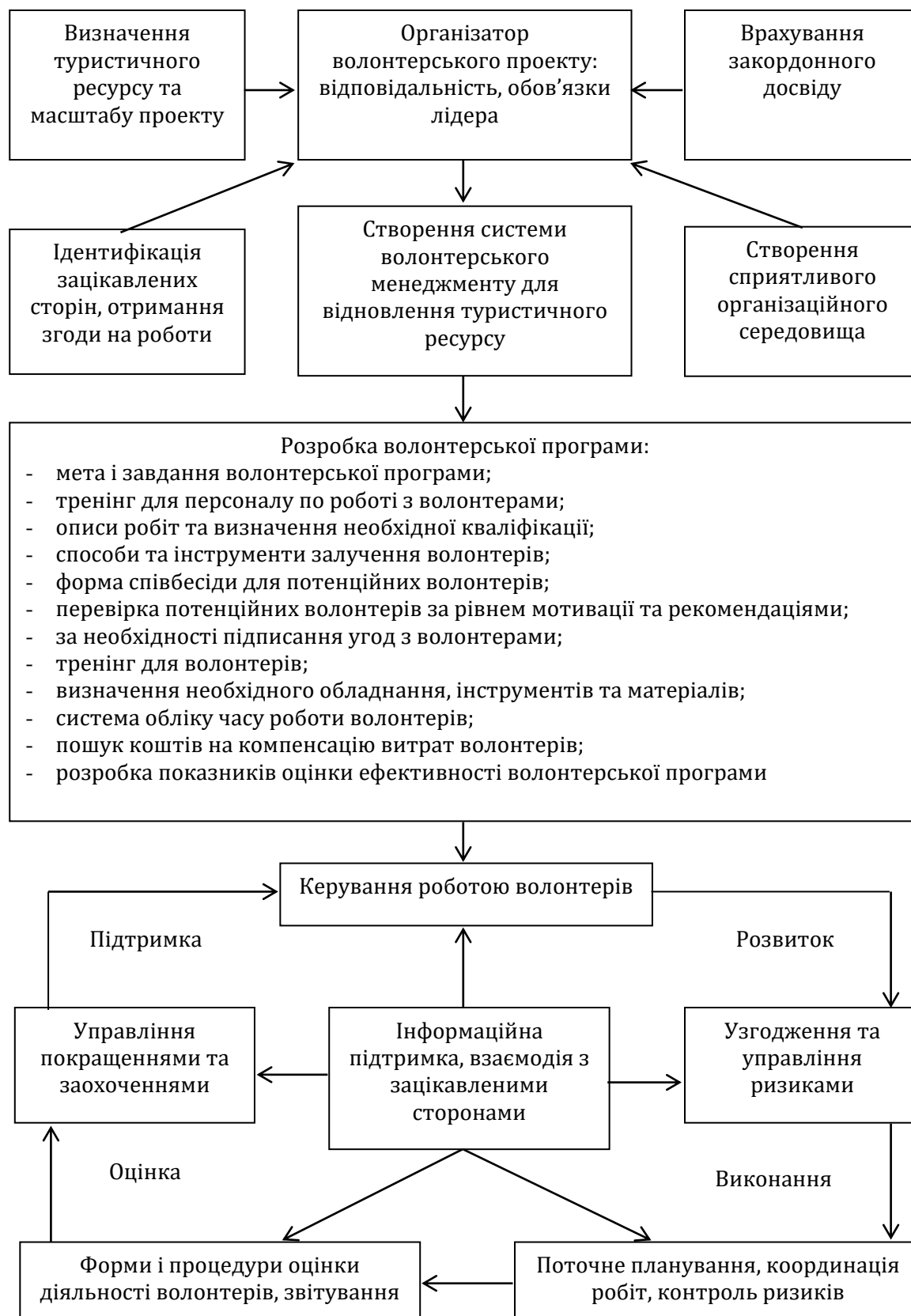
Рис. 1. Схема функціонування волонтерського менеджменту організатора проекту