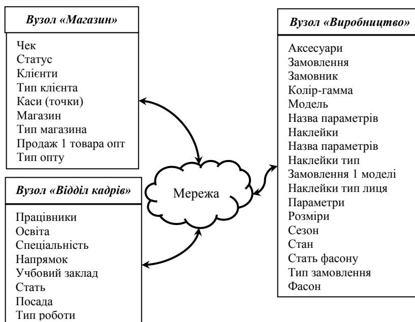
Рис. 1. Вузлова схема розподіленої БД для швейного підприємства

Структуру бази даних, що відповідає розробленій вузловій схемі, наведено на рисунку 2. В дослідницьких цілях розроблену БД було застосовано на швейному підприємстві «М-Шарм» (м.Хмельницький), де було підтверджено ефективність її використання. Ефект від впровадження БД в першу чергу спостерігався у: