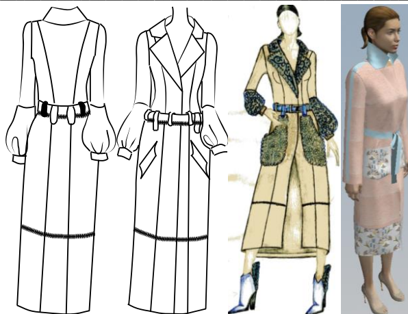
Рис. 2. Візуалізація варіантів моделей колекції

Вихідні зображення принтів конвертовано у середовище Rhinoceros для створення об'ємних просторових об'єктів та наступного 3D-друку. Rhinoceros – графічний редактор тривимірного проектування, який дозволяє виконати широкий спектр робіт, пов'язаних зі складними об'єктами, що виготовлені із гнучких матеріалів [4]. Для тривимірного друку вихідне зображення перетворене у поверхню (рис. 3), з наступним перетворенням у полігональну сітку та збереженням у форматі файлу стереолітографії (stl).