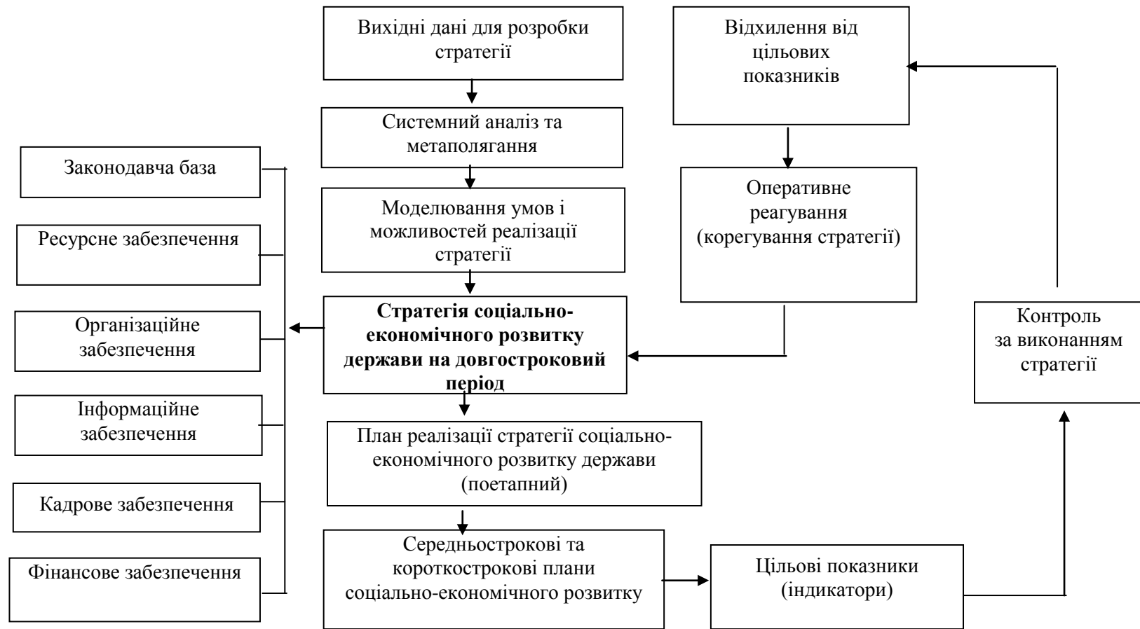
Рис. 2. Схема стратегічного планування соціально-економічного розвитку країни Складено автором.