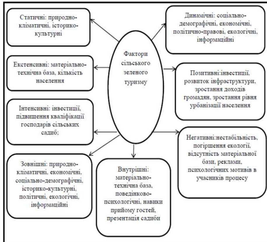
Рисунок 1.2 - Класифікація чинників у агро-, фермерському туризмі [14.]

Не зважаючи на те, що немає єдиного підходу до тлумачення поняття «агротуризму» та «фермерського туризму» можна сказати, що ці види туризму мають вагомe соціально-економічне значення, яке полягає в тому, що вони: стимулюють розвиток селянських господарств, які займаються— зеленим туризмом; сприяють розвитку місцевої інфраструктури;— сприяють збуту надлишків сільськогосподарської продукції,— збільшуючи додаткові прибутки селян і відрахування у місцеві бюджети; активізує місцевий ринок праці, підвищує зайнятість, затримує— молодь на селі, понижуючи потребу в закордонному заробітчанстві; сприяє охороні туристичних ресурсів, насамперед збереженню— етнокультурної самобутності українців; створює можливості для змістовного відпочинку незаможних— людей; сприяє підвищенню культурного рівня мешканців села та— підвищенню екологічної свідомості. У наступному підрозділі нами буде досліджено Методичні