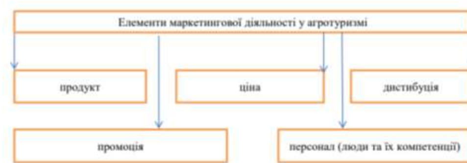
Рисунок 3.1 - Елементи маркетингової діяльності у фермерському туризмі

У маркетинговій діяльності виділяють наступні елементи, активізація яких може підвищити ефективність маркетингової стратегії фермерського туристичного підприємства: продукт, ціна, дистрибуція, промоція, персонал (люди та їх компетенції) (рисунок 3.1)