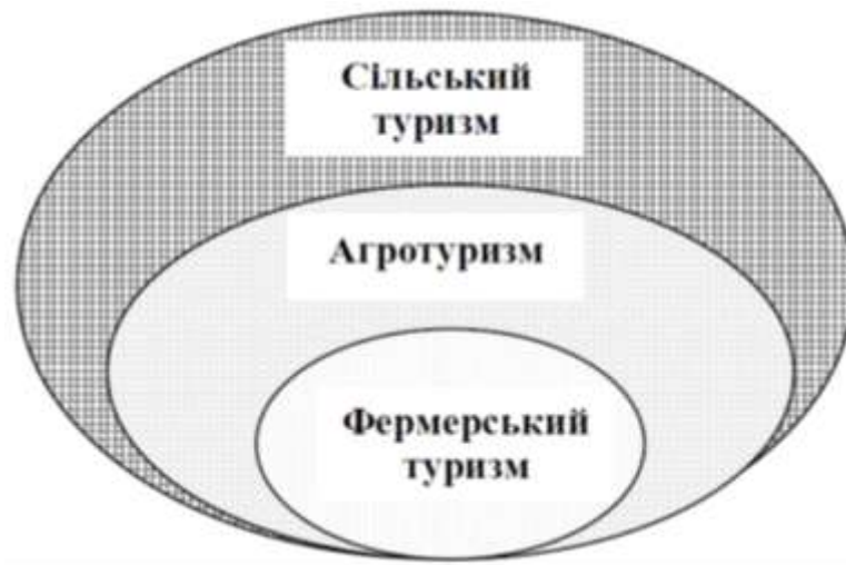
Рисунок 1.1 - Зв'язок між поняттями «сільський туризм», «агротуризм» і «фермерський туризм». [10]

Обґрунтуємо основні компоненти сільського зеленого туризму, які заохочують туристів відвідати сільські місцевості.