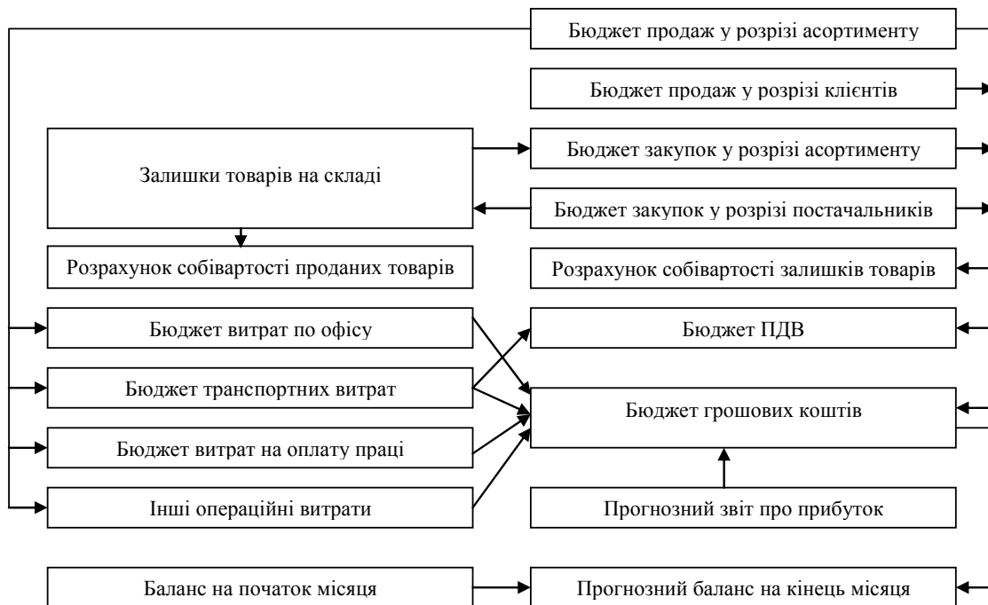
Рис. 2. Структура місячного бюджету торгівельного підприємства

Приклад місячного бюджету, що є більш деталізованим у порівнянні з річним бюджетом, наведений на рисунку 2.