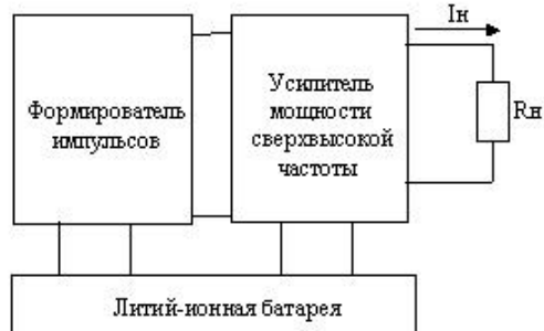
Рис. 1. Традиционная схема питания СШП мобильных радиолокаторов

Питание генератора зондирующих импульсов СШП мобильного радиолокатора осуществляется от литий-ионной батареи напряжением U_B=3,6 В, которая характеризуется значениями внутреннего активного сопротивления в пределах R_{вн}=300 мОм (рис. 1).