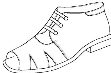
Рис. 1. Дитячі ортопедичні черевики з настроченими берцями і відкритою носковою частиною

Нами було спроектовано в автоматизованому середовищі AutoCAD дитячі ортопедичні черевики з настроченими берцями і відкритим носком клейового методу кріплення з висотою припіднятості п'яркової частини 10 мм, закріплення його на стопі за допомогою шнурівки; індекс колодки для проектування деталей верху і низу взуття 6312-ОД, розмір спроектованого взуття 185, повнота – 2. При проектуванні ми керувалися вимогами стандарту, у відповідності з яким виготовляється взуття, а саме ДСТУ ГОСТ 26165:2009 [5]. Ескіз спроектованих черевиків наведено на рис. 1.