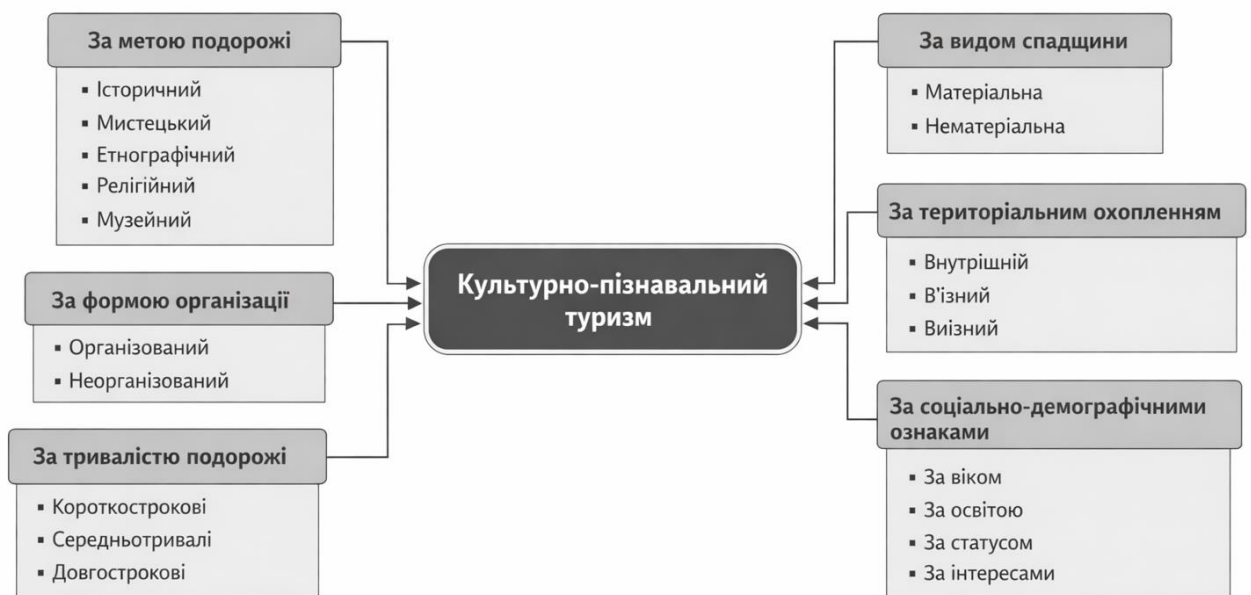
Рисунок 1.1 – Класифікація культурно-пізнавального туризму

Окрему групу становлять класифікації за соціально-демографічними характеристиками туристів, що враховують вік, рівень освіти, соціальний статус та культурні інтереси споживачів туристичних послуг. Такий підхід є важливим у контексті маркетингових досліджень та формування диференційованих туристичних продуктів [7]. Узагальнена класифікація культурно-пізнавального туризму наведена на рисунку 1.1.