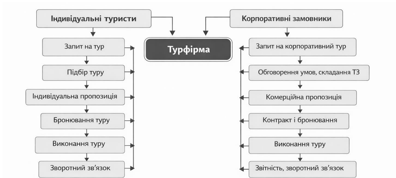
Рисунок 2.1 – Організаційно-технологічні процеси

Асортимент побудований таким чином, щоб поєднати комерційну привабливість й автентичність DESTИНАЦІЙ. Сегментація споживачів здійснюється за віком, мотивацією поїздки, платоспроможністю і тривалістю туру. Такий підхід дозволяє формувати диференційовані продукти, адаптовані під різні потреби. Управлінські процедури передбачають планування сезонних продуктів, оцінку рентабельності маршрутів, контроль якості екскурсійного супроводу та оперативне врегулювання клієнтських звернень (рисунк 2.1).