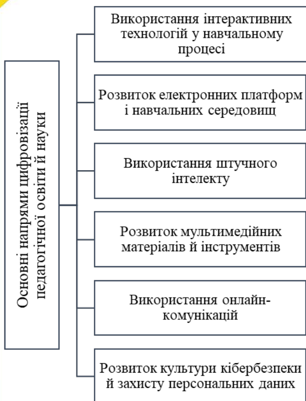
Рис. 2. Основні напрями цифровізації педагогічної науки в Україні

Важливою складовою розвитку особистості й суспільства на сьогодні є неформальна освіта, роль якої стає все більш значущою в умовах швидкого технологічного прогресу. Неформальна освіта дає змогу людям здобувати нові знання і навички в межах різних професій та інтересів, що є особливо важливим у контексті постійного розвитку суспільства й швидкої зміни потреб [3, с. 37].